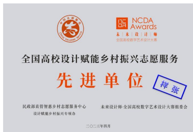
全国高校设计赋能乡村振兴先进单位牌匾